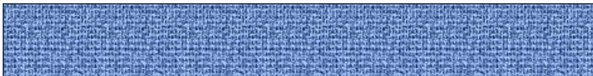
Slika 1. Naslov slike.

Ukoliko je potrebno ispod tablice se stavlja legenda odnosno objašnjenja skraćenica u tablici.