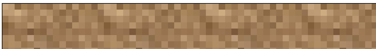
Slika 2. Naslov slike.