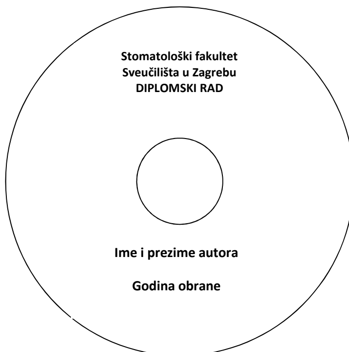
SLIKA 12. Izgled CD-a