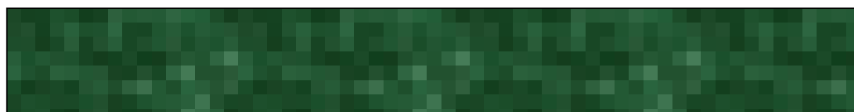
Slika 3. Naslov slike.

Pismo: Times New Roman Veličina: 12 Prored: 1,5 Poravnanje naslova: središnje