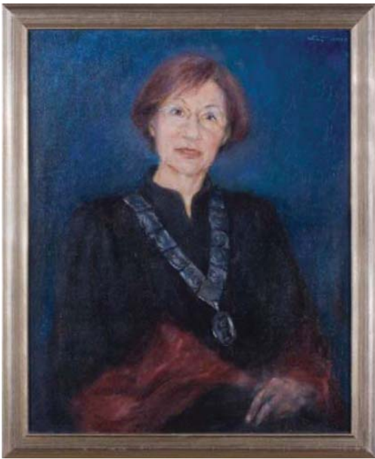
Portret H. J. Mencer (Galerija rektora - aula) Autor: Zlatko Kauzlarić Atač, Zagreb 2006.